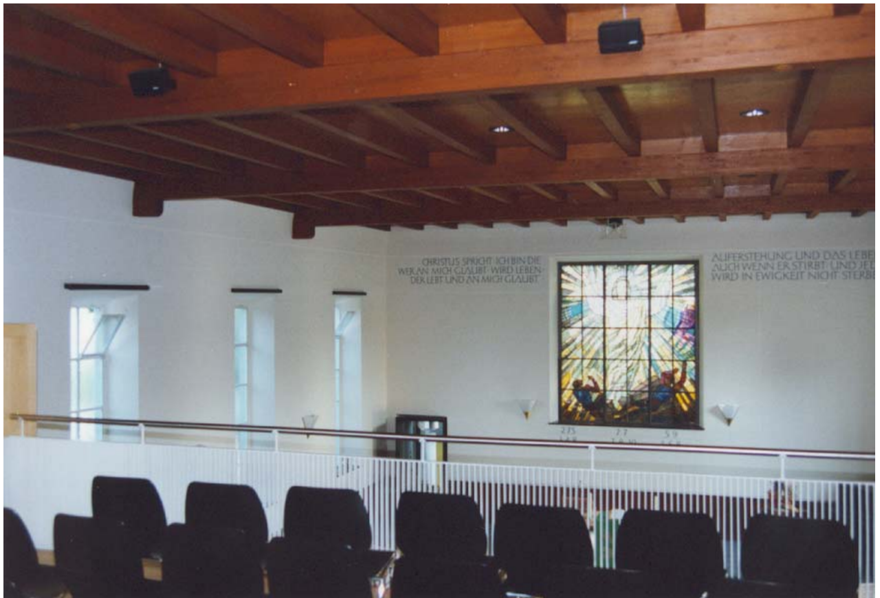
Sicht von der Empore in Richtung Chor